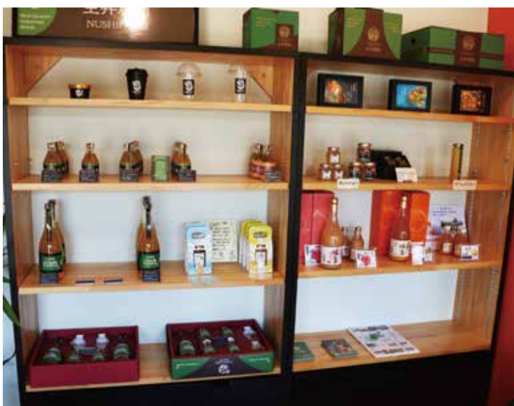
店内には、かんきつ類を使ったさまざまな商品が並ぶ

今後について「農業では新しい品目にもどんどん挑戦して、それをカフェでも提供し、みんなに食べてもらいたい」と目標を語ってくれました。