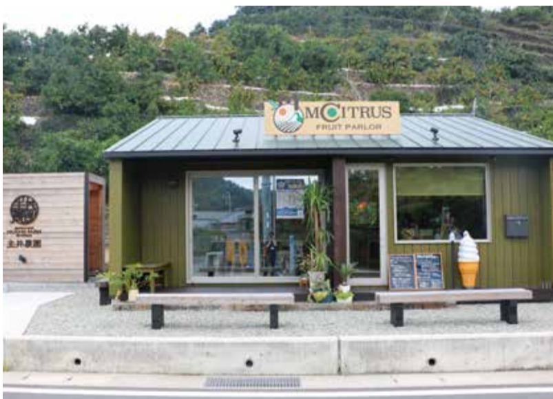
みかんの木をイメージした外観はお客さんの目をひくのでフォトスポットとしても人気

浅町の観光地のひとつになればという思いを含め、カフェを始めると決意しました。地元のかんきつ類を使ったソフトクリームは県内外問わず人気でリピートしてくれるお客さんも多くいます。