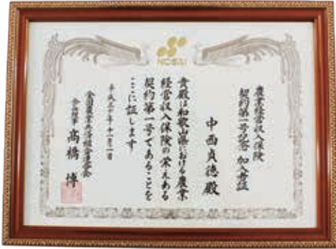
収入保険第1号認定証 【和歌山県】

どんなに備えをしても、台風のような自然災害は自分では防ぎきれません。農業はそのような自然災害のリスクもあり、常に安定していないものだと思います。私は、これから農業で家族を養っていくあたり、万が一の時でも資金面のバックアップがある保険があれば良いなど感じていました。収入保険に加入していれば、万が一の時でも収入の8割を補償してくれるという点が加入の決め手でした。