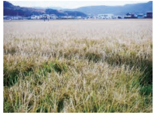
強い潮風に当たり、枯れた水稲 (美浜町)